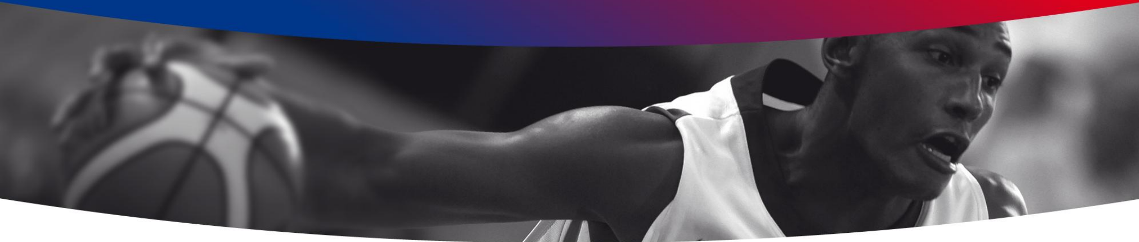
Schéma de Développement Territorial