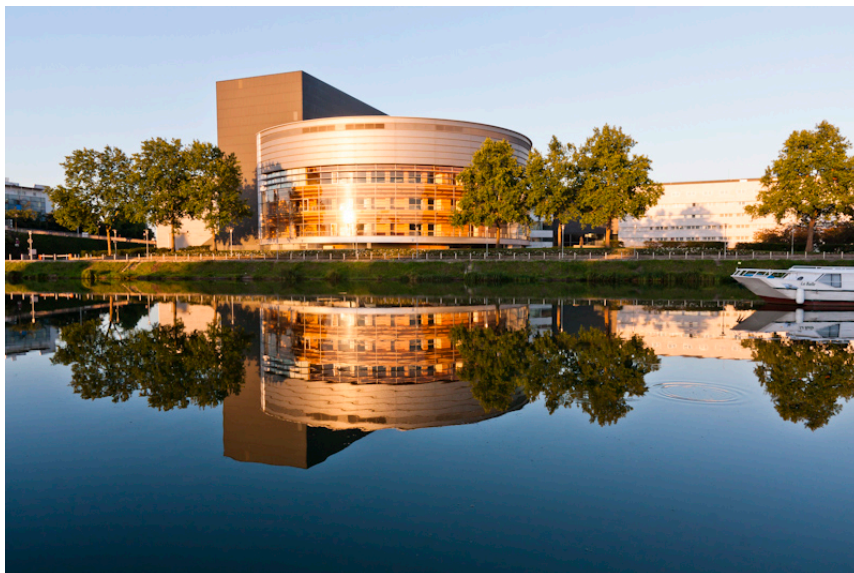
Cité des Congrès de Nantes

21h00 : Dîner à l'Hôtel du Département (Bureau Fédéral, DOM/TOM)