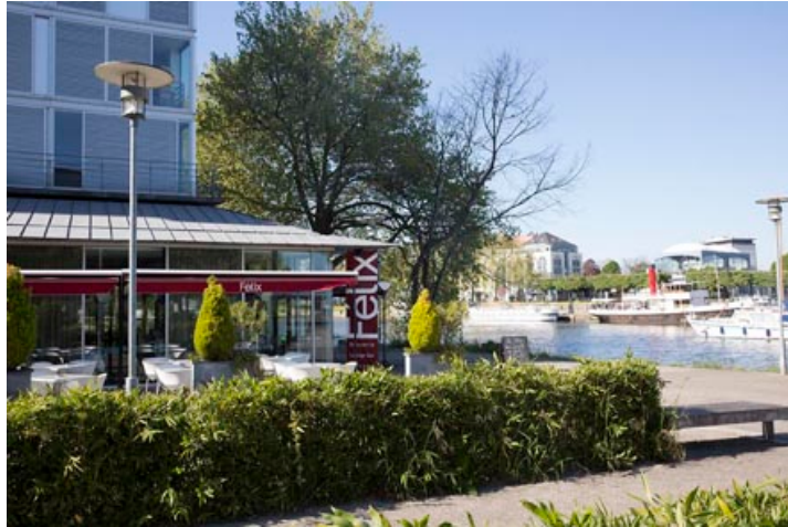
Restaurant Le Félix

12h00 – 14h00 : Déjeuner ( Restaurant « Le Félix » )