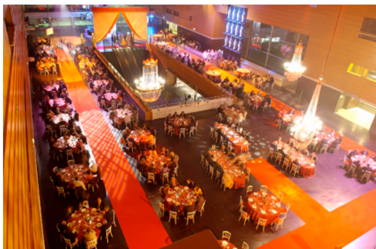
La Grande Halle de la Cité des Congrès