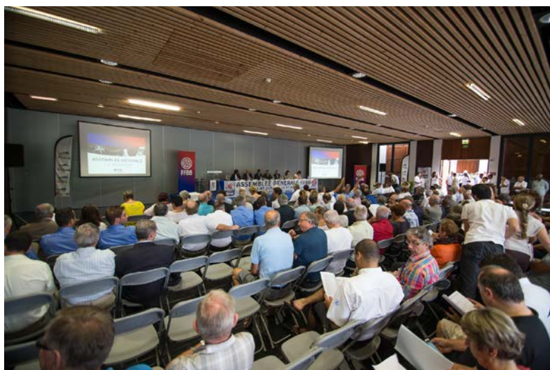
Assemblée Générale de la FFBB en 2014 Au Centre MOCA de Saint-Denis de La Réunion