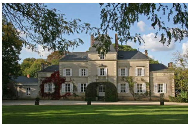
Le château de la Pigossière

20h00 : Dîner régional ( Château de la Pigossière )