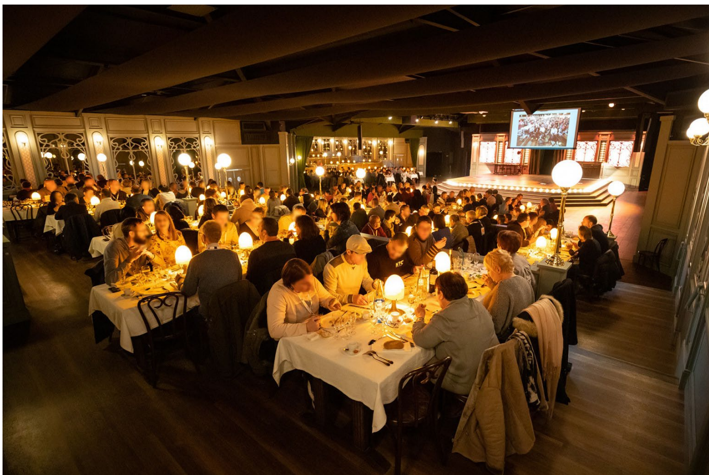
Café de la Madelon – Dîner de Gala

Dans la soirée, au cours de la soirée de Gala , la FFBB remettra les distinctions honorifiques fédérales dont les Coqs de bronze, d'argent et d'Or , puis le Trophée Robert Busnel-Yvan Mainini , plus haute distinction fédérale.